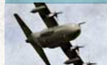
Lockheed C-130 Hercules

Transporter für Truppen, Gerät und das Medical-Evacuation-Modul bei Auslandsmissionen