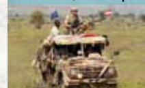
Puch G 290/LP Sandviper

Patrouillen-Fahrzeug für Spezialeinsatzkräfte, z.B. Jagdkommando-Soldaten im Tschad