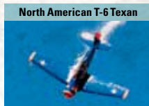
North American T-6 Texan

Einstrahliger Jettrainer, ca. 2.900 Exemplare an über 30 Luftwaffen ausgeliefert