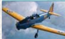
Fairchild M62A PT-19

Offener Basistrainer der US Army aus den 1940ern, ca. 7.700-mal gebaut