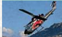
Bell TAH-1F Cobra

Letztes flugfähiges Exemplar der einmotorigen Version und einzige Cobra in Europa