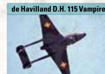
de Havilland D.H. 115 Vampire

Zweistrahliges Mehrzweckkampfflugzeug mit hervorragenden Kurveneigenschaften