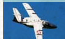
Saab 105 Ö

Schul- und Identifizierungsflugzeug, u. a. einsetzbar zum „Luftspüren“ nach Elementarereignissen (z.B. Vulkanausbrüchen)