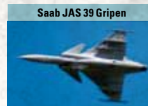
Saab JAS 39 Gripen

Kampfhubschrauber mit zwei Gasturbinen-Triebwerken, kann auch Truppen transportieren