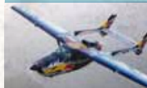
Cessna 337 Skymaster

„Push-Pull“ genannt wegen des Zug- und des Druckpropellers, unüberhörbarer Sound