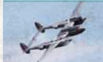
Lockheed P-38L Lightning

Dreirumpf-Konstruktion aus dem 2. Weltkrieg, einziges flugfähiges Exemplar Europas