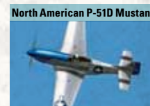
North American P-51D Mustang

Leichtes Angriffs- und Aufklärungsflugzeug aus den späten 1960er-Jahren