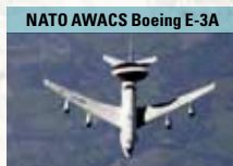
NATO AWACS Boeing E-3A

Moderne viersitzige Propellermaschine des österr. Flugzeugherstellers Diamond Aircraft