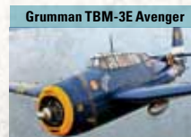
Grumman TBM-3E Avenger

1949 bis 1990 bei der Schweizer Luftwaffe als Blindflugtrainer im Einsatz