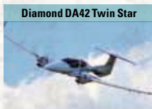
Diamond DA42 Twin Star

Zweisitzige Version des leichten Erdkampfflugzeugs für das Fortgeschrittenen-Training