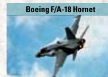
Boeing F/A-18 Hornet

Deltaflügler aus schwedischer Produktion, universell einsetzbar und einfach zu warten