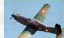
Pilatus PC-7 Turbo Trainer

Voll kunstflugtaugliches Mehrzweckschulflugzeug für Grund- und Fortgeschrittenenausbildung