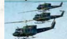
Agusta Bell 212

Helikopter für Außenlasttransporte, Lösch-, Mess- und Rettungsflüge (mobile Intensivstation)