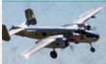
North American B-25J Mitchell

Konzipiert als mittelschwerer Bomber der Alliierten, hat zwei 14-Zylinder-Doppelsternmotoren