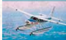
Cessna 208 Amphibian Caravan

Einmotoriges Amphibienflugzeug mit Propellerturbine mit 675 PS