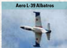
Aero L-39 Albatros

Militärischer Mehrzwecktransporter, ausgelegt für kurze Start- und Landebahnen