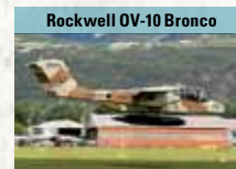
Rockwell OV-10 Bronco

Torpedobomber der US-Marine-Streitkräfte im 2. Weltkrieg, ca. 9.830-mal gebaut