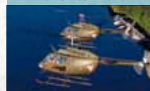
Bell OH-58B Kiowa

Bewaffneter leichter Verbindungshelikopter für Aufklärungsflüge vor Luftlandeoperationen