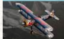
Boeing PT-17 Stearman

Doppeldeckerkonstruktion mit 450 PS starkem 9-Zylinder-Sternmotor