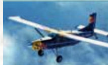
Pilatus Porter PC-6

Mit Propellerturbine ausgerüstetes Absetzflugzeug für das Red Bull Skydive Team