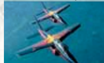
Dassault/Dornier Alpha Jets

Weltweit die ersten demilitarisierten und zivil zugelassenen Alpha Jets