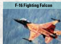
F-16 Fighting Falcon

Meistexportiertes westliches Mehrzweckkampfflugzeug, in 25 Luftwaffen im Einsatz