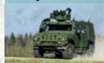
Iveco Light Multirole Vehicle

Leichtes Mehrzweckfahrzeug für Transport-, Patrouillen-, und Aufklärungseinsätze