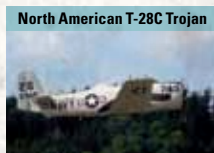
North American T-28C Trojan

Schwanzloser Deltaflügler aus französischer Produktion, erreicht Mach 2,2