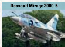
Dassault Mirage 2000-5

Wendiges zweistrahliges Mehrzweckkampfflugzeug, beherrscht das Cobra-Manöver