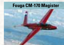
Fouga CM-170 Magister

Meistexportiertes westliches Mehrzweckkampfflugzeug, in 25 Luftwaffen im Einsatz