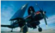
Chance Vought F4U-4 Corsair

2.100 PS starker Warbird mit hochklappbaren Tragflächen, gebaut 1945