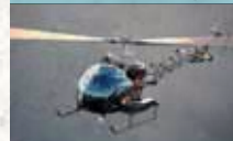
Bell 47 G-3B-1 Soloy

1947 als erster Helikoptertyp zivil zugelassen, besitzt ein markantes Glascockpit