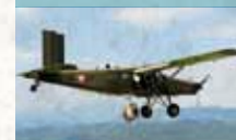
Pilatus PC-6 Turbo Porter

Schulterdecker für Transport-, Lösch-, Bild- und Verbindungsflüge, gute Kurzstart- und Kurzlandeigenschaften