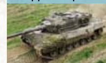
Kampfpanzer Leopard 2A4

Extrem beweglicher Kampfpanzer, Hauptwaffensystem der österreichischen Panzertruppe