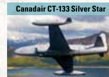
Canadair CT-133 Silver Star

Einmotoriges kolbenmotorgetriebenes Jagdflugzeug, 1945-55 ca. 860-mal gebaut