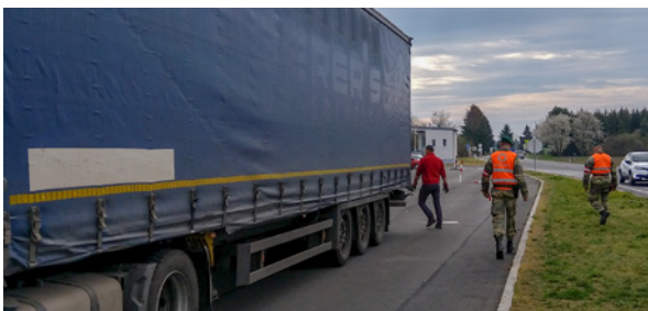
Schutz der Demokratie