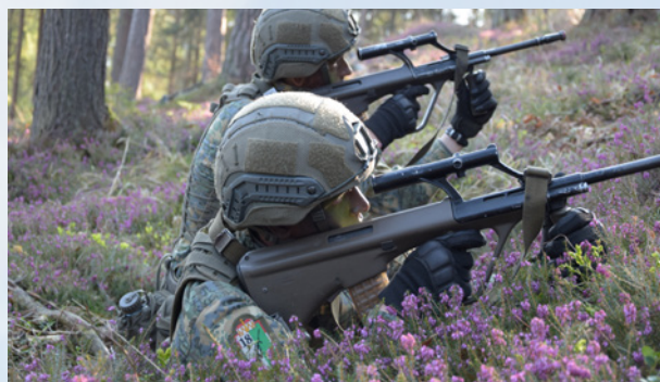
Soldaten bei der Gefechtsdienstausbildung

Die Landesverteidigung ist die primäre Aufgabe des Bundesheeres, daher ist es notwendig, eine umfassende Ausbildung der Grundwehrdiener sowie der Berufssoldaten im täglichen Dienstbetrieb durchzuführen. Kaderanwärterausbildungen für den Kadernachwuchs sowie die Ausbildung der Miliz gehören ebenfalls zum Tätigkeitsbereich des Verbandes.