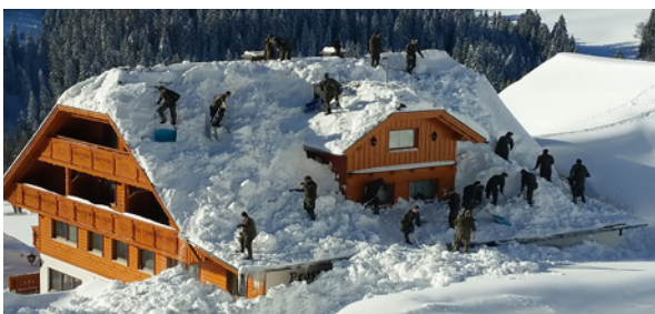
Hilfe im Inland