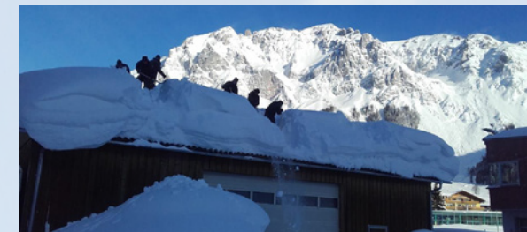
Soldaten beim Abschaufeln von Dächern

Die Soldaten unterstützen die Bevölkerung bei Naturkatastrophen, wie z. B. bei Hochwasser-, Schnee- und Sturmereignissen oder bei sonstigen Unglücksfällen. Ein gemeinsames Miteinander mit den Behörden und den Blaulichtorganisationen steht hierbei immer im Mittelpunkt.