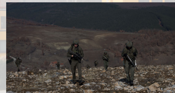
Soldaten bei einer Fußpatrouille im Kosovo

Bei sehr vielen internationalen Einsätzen (Mali bis Afghanistan) sind bzw. waren Soldaten des Jägerbataillons 18 beteiligt. Der Verband war im Jahr 2008 als erstes Bataillon sogar geschlossen im Auslandseinsatz (Kosovo). Derzeit verfügt das Bataillon über eine Kaderpräsenzeinheit, welche aus längerdienenden Soldaten besteht.