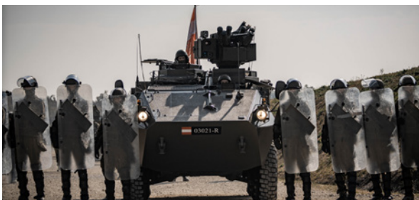
Hilfe im Ausland