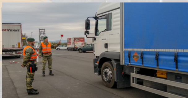
Soldaten bei einer Fahrzeugkontrolle

Immer wieder werden Soldaten zum Zwecke des sicherheitspolizeilichen Assistenzeinsatzes gestellt, um die Staatsgrenzen zu schützen.